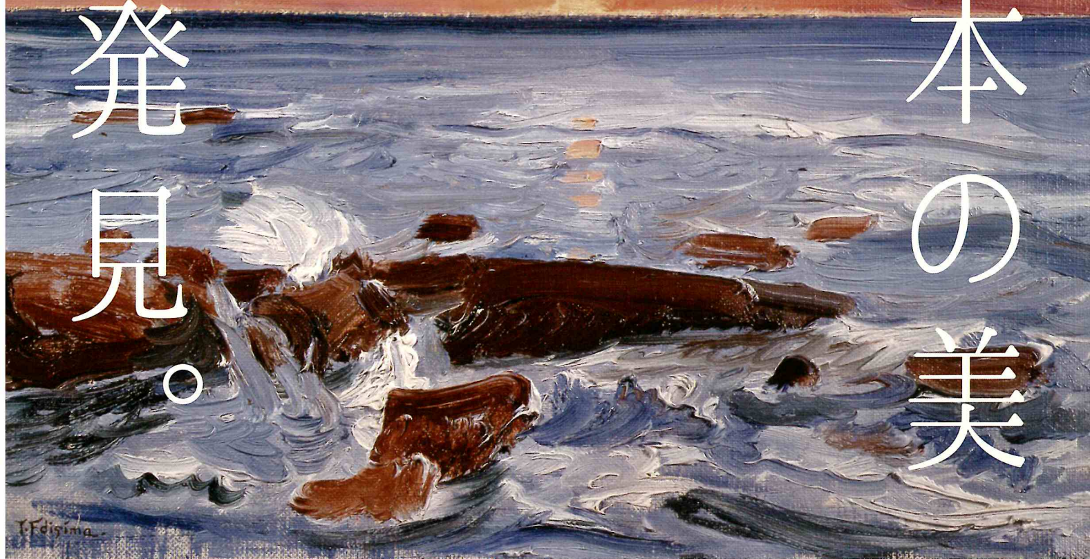
藤島武二《日の出》1931年頃(取材地:茨城県大洗海岸) 笠間日動美術館蔵