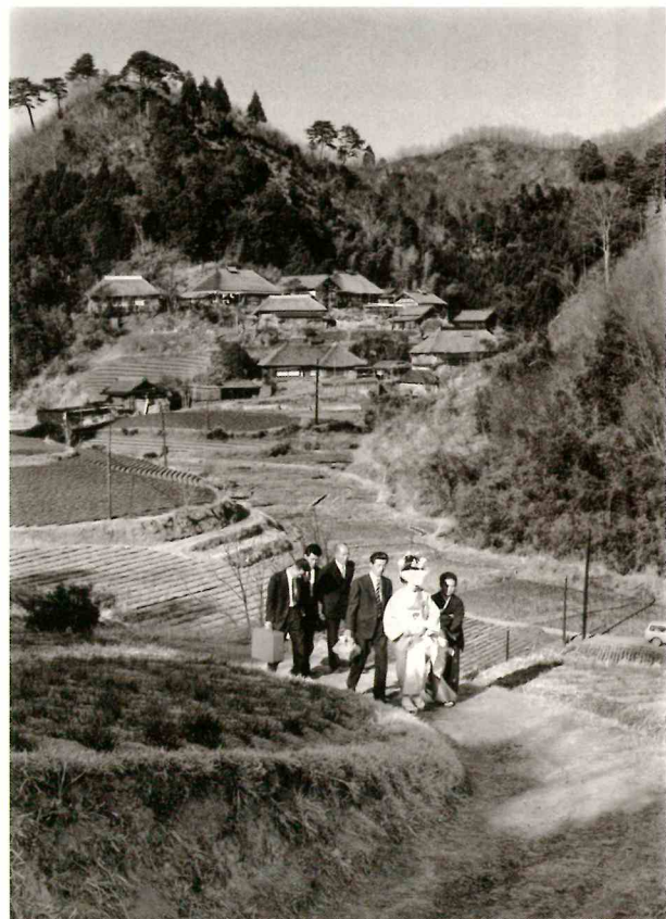
《農村の花嫁》撮影:柳下征史 1968年 茨城県久慈郡金砂郷村(現 常陸太田市)